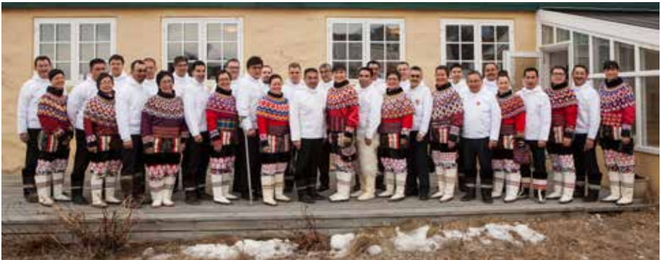
Ulloq 5. april inissititerneq

Ukiakkut ataatsimiinnerup nalaa-ni PI naalackersuisooqataajun-