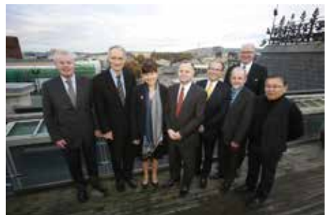
Nunani Avannarlerni Inatsisartut siulittaasui

ngasuusuni inatsisartut siulittaasogarfiisa sinniisaannit tamanit peqataaffigineqartumik ataatsimiisitsineq iluatsippoq, tassanilu nunani avannarlerni inatsisartuni ataatsimut ajornartorsiutit oqalli-