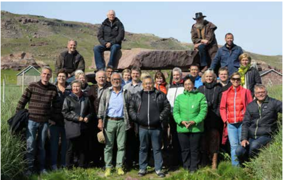
NAKS-imut aallartitat Igalikumi Narsarsuarmi ukiumoortumik ataatsimiinnermut atatillugu