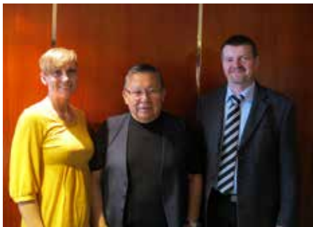
Nunat Avannarliit Killiit Siunnersuisoqatigiiffiata siulittaasoqarfittaavaa

Ukioq manna aamma juunimi Norgeliartoqaqqippoq, tamatumani Nunat Avannarliit Killiit Siunnersuisoqatigiiffiata siulittaasoqarfia Bodømi Nunat Avannarliit Siunnersuisoqatigiiffiata siulittaasoqarfiata aasaanerani ataatsimiinneranut peqataanermut nangissutitut Bodømi siullermeerutaasumik ataatsimiimmat.