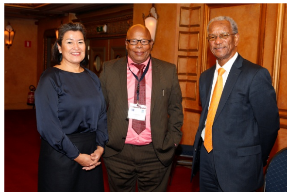
Aleqa Hammond naalackersuisut siuttuulu Anguillameersoq taavalu De Britiske Jomfruøernerneq, decemberi 2013-mi

EU-p nunallu imarpiuk akianiitut 25-t akornanni, Kalaallit Nunaat ilanngullugu, kattunnermi siunertaq tassaavoq OLT-imi ilaasortat aningaasarsiornikkut inuuniarnikkullu ineriartornerat siuarsassallugu kiisalu OLT-ip EU-llu akornanni aningaasaqarnikkut qanittumik atassutit aalajangiussimassallugit. OLT-imi ilaasortat naalackersuinikkut iluarsaassinikkut EU-mi nunanut ilaasortanut sisamanut Tului Nunaannut, Hollandimut, Frankrigimut Danmarkimullu atassuteqarput. OLT-imi ilaasortat annertuutigut namminersortuupput EU-milu akitsuuserinermut ilaanatik imaluunniit EU-p iluani niuerfimmumut ilaanatik taamatullu EU-mi inatsisit avataaniillutik. OLT-imi ilaasortat nunat siuarsagaanngillat, kisianni annikitsumik aningaasaqarfiuermikkut, inukitsuunermikkut annikitsumillu allaffeqarnermikkut immikkut unamminartoqarlutik EU-mullu naleqqiullutik avinngarusimasuullutik. Ataatsimut isigalugit OLT-imi nunat ilaasortat katillutik 1,2 mio.-inik innuttaqarput. OLT-imi innuttaasut nunami ilaasortaasumi innuttaasutut EU-milu innuttaasutut naatsorsuutigineqarlutik.