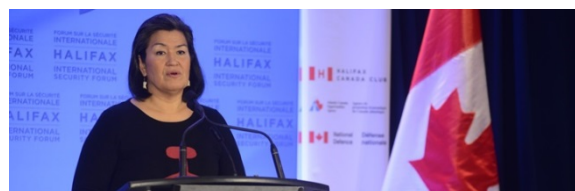
Aleqa Hammond Halifax Forumimi Canadami oqalugiartooq, November 2013

Siulittaasup taamaalilluni periarfissat arlallit atorluarsimavai, Kalaallit Nunaanni aningaasaliinissamut periarfissat nittarsaanniarlugit oqalugiartussatut qaaqquneqartarluni – ilaatigut Canadami Londonimilu. Aammattaaq decembari 2014-mi pisortatigoortumik Japanimut tikeraarnissaq pilersaarusiorneqarluni tikeraarnerutaaq nalaani inuussutissarsiornermut tunngasunik inuussutissarsiortut attuumassuteqartut peqataatinneqassapput.