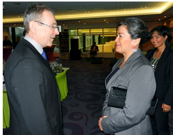
Aleqa Hammond ineriartortitsinermit kommissæri Andris Piebalgs peqatigalugu, januar 2014

Naalakkersuisut siulittaasuut danmarkimilu nunanut allanut ministeri taakkulu Bruxellesimi aallartitaat tamarmik immikkut suliassaminnik naammassiniagaqarput, politikerini ataatsimiinnerit EU-mi kommissærinik attuumassuteqartunik pilersinneqarlutik.