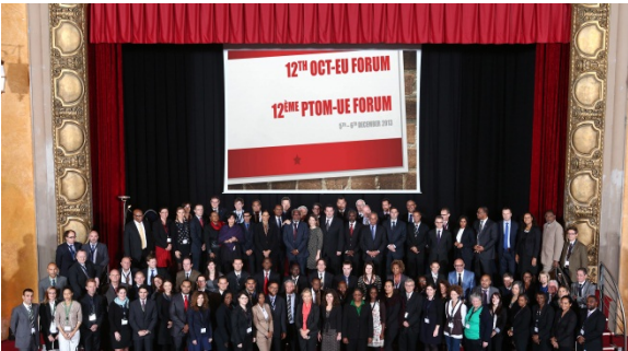
OLT-EU Forum-imi decemperi 2013-mi peqataasut

Tunngaviummik isumaqatigiissutit Kalaallit Nunaata EU-llu akornanni isumatigiissutinut attuumassuteqartuusut 2013-mi kiisalu 2014-p aallartinnerani naammassillugit isumaqatigiissutigineqarput, ukiuni arlalinni piareersartoqareersoq sivisuumillu isumaqatiginninniartoqareersoq. Tunngaviummik isumaqatigiissutit naammassiniarnerini Sinniisoqarfik nunanut allanut ministeriaqarfimmik qanittumik ataqatigiissaarisimavoq.