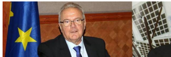
Europa Kommissær Neven Mimica ulluni 1.-2. Juni 2017 Nuummikarlunilu ilulissanukarpoq.

Kalaallit Nunaat pillugu soqutiginninneq EU-qarfimmi aamma EU-mi nunat ilaasortat akornanni aalajangiussimaniarlugu Bruxellesimi Sinniisoqarfik qaffasissumiittut Kalaallit Nunaannut tikeraarnissaat qulakkeerniarlugu suliaqarput. Nunat tamalaat suleqatigiinnerinut Ineriartornermullu Kommissæri, Neven Mimica, ulluni 1.-2. juni 2017-imi Kalaallit Nunaannut tikeraarpoq.