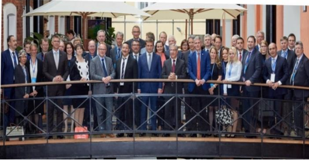
Atlantikup avannaamiut aalisarnermut ministerii aallartitaallu Skt. Petersborg 8. juni 2016.