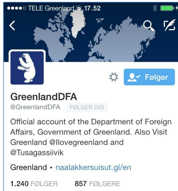
Twitter-profil for @GreenlandDFA.

Nunanut Allanut Pisortaqarfik twitterprofil-eqarpoq @GreenlandDFA tassani public diplomacy-mi sulineq siullertut suliarineqartarluni. Tassuuna oqariartuutit assilluunniit sammisassaqtitsinermeersut Naalakkarsuisumit nunanut allanut tunngasuni suliaqartumit, Nunanut Allanut Pisortaqarfimmit imaluunniit ilaatigut Namminersorlutik Oqartussanit peqataaffigineqartunit pisut.