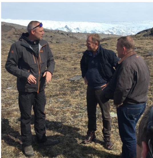
EU-p præsidentia Donal Tusk 17-18. Maj 2016 tikeraarpoq

Taakku saniatigut Issittoq EU-mi Bruxelles-imilu pingaartinneqaleraluttuinnarpoq taamaattumillu tamanna pillugu Sinnisoqarfiup ulluinnarni sulinermini pingaartittussaavaa.