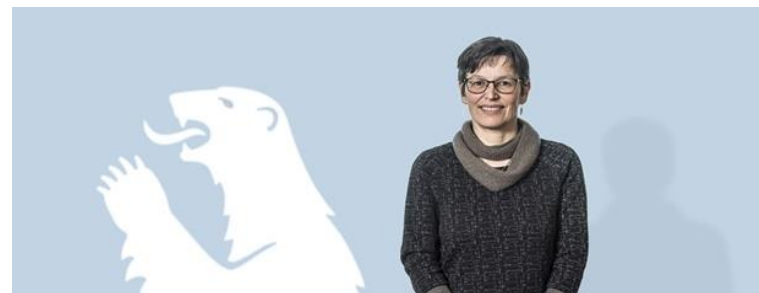
Namminiilivinnermut, Nunanut allanut Nunalerinermullu Naalakkersuisoq Suka K. Frederiksen

Kalaallit Nunaata nunanut allanut suliassaqarfianut suliassat unammilligassat takkuttuarput. Ukioq takkuttussaq pissanganarlunilu unammilligassaqassaaq. Nunanik allanik isumaqatigiissuteqartarnertigut nunanut allanut tunngasut Kalaallit Nunaata politikkikkut aningaasaqarnikkullu ineriartornissaa qulakkiissavaat.