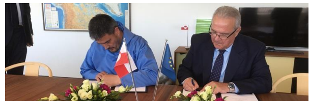
Naalackersuisut Siulittaasuata Kim Kielsen aamma Europami Kommissæri Neven Mimica sisamanngornermi ulloq 2. juni 2017 aningaasat pillugit isumaqatigiissut 2017-imoortoq atsiarpaat.

Ataatsimiinneq naggaserlugu ukioq mannamut aningaasat pillugit isumaqatigiissut atsioqatigiissutigineqarpoq, taamaaliornikkut suleqatigiinnissamut isumaqatigiissut naapertorlugu EU-p Kalaallit Nunaannut aningaasaliissutai nuunneqarsinnaanngussallutik.