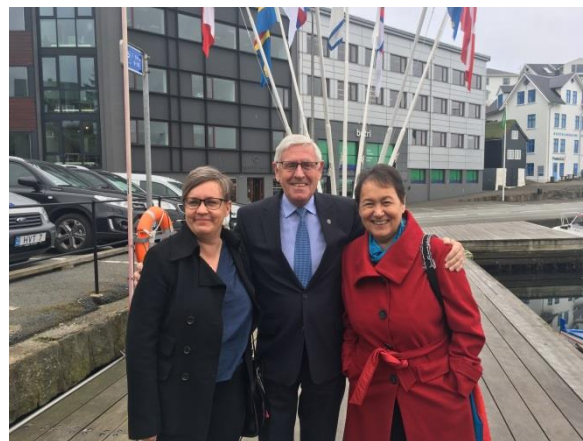
Talerpillermiit takuneqarsinnaavoq Peqqissutsimut Nunallu avannarliit Suleqatigiinnerannut Naalakkersuisoq Agathe Fontain, Savalimmiuni Inuussutissarsiornermut, Nunanut allanut aamma Nunat avannarliit suleqatigiinnerannut ministeriat Poul Michelsen aamma Ålandip Nunat avannarliit suleqatigiinnerannut ministeriat Nina Fellman Torshavnimiittut, maj 2017.

November 2016-imi Nordisk Rådipi kalaallit aallartitaannut siulittaasoq aamma Nunat avannarliit suleqatigiinnerannut Naalakkersuisoq Nordisk Rådipi aamma Nunat Avannarliit Ministeriisa Siunnersuisoqatigiiffiani ataatsimiinnerni peqataasarnermi oqalutsimik ikiorteqarnissaq pillugu Nordisk Rådiput aamma Nunat Avannarliit Ministeriisa Siunnersuisoqatigiiffianut peqatigiillutik saaffiginnissuteqarput. Suliassat immikkut Nunat Avannarliit Siunnersuisoqatigiivinit aamma Nunani Avannarlerni Ministerit Siunnersuisoqatigiivinit suliarineqarput. April 2017-imi Nunat Avannarliit Ministeriisa Siunnersuisoqatigiiffiani aalajangiinnermi aalajangerneqarpoq Nunat Avannarliit Ministeriisa Siunnersuisoqatigiiffianni ataatsimiinnerni Naalakkersuisunut ilaasortanut nutserussinermi aningaasartuutit Nunat Avannarliit Ministeriisa Siunnersuisoqatigiiffianit matussuserneqartassasut peqatigisaanillu kalaallit tungaanniit nammineq aalajangerneqartassasoq kina nutserisuussanersoq. Nassuiaatip matuma suliarinerani suliaq suli Nordisk Rådipi naammassillugu suliarineqanngilaq.