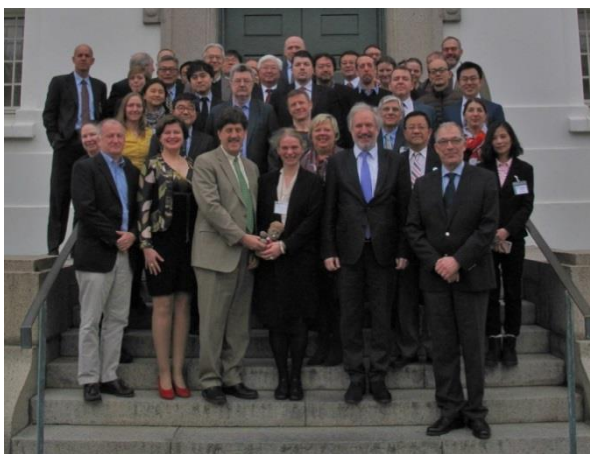
Issittup imarpittaani aalisarneq pillugu isumaqatigiissutissaq pillugu isumaqatigiinniaqataatitassat, Reykjavík 18. marts, 2017.

Kalaallit Nunaat Aalisarnermut Piniarnermullu Naalakkersuisoqarfikkoortumik kunngeqarfiup isumaqatigiinniartitaanik aqutsisuuvoq. Kunngeqarfiup isumaqatigiinniartitaanut taakku saniatigut ilaapput ICC Grønland, danskit Nunanut allanut ministeriaqarfiannit sinniisuutitaq taamatullu Savalimmiuni Naalakkersuisut sinniisuat.