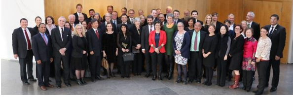
Ambassadørit Kalaallit Nunaanni pingaarutilimmik inissisimasut arlaqartut naapippaat Namminiilivinnermut, Nunanut Allanut, Nunalerinermullu Naalakkersuisoq, marlungorneq majip 30-ani Naalakkersuisut sinnerlugit nereqatigiinnermut qaaqqusimmat.