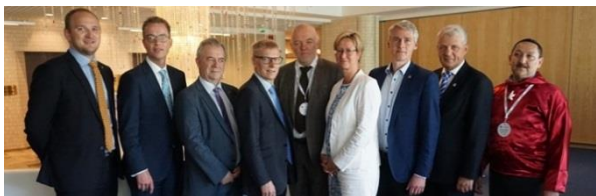
Nunat Avannarliit Inuussutissalerinerimut, Nunalerinerimut Aalisarnermullu ministerii Turkumi 29. juni 2017.

Aammattaq Naalakkersuisup siunnersuutigaa, imaani isumalluutit pitsaannerusumik atornissaannut tunngatillugu nutaamik ineriartortitsineq tulleriiaarinerni ilaasariaqartoq. Nunat avannarliit uumasut tunngavigalugit aningaasarsiorneq pillugu paasisimasalittut sassartitaasat imaani uumasunik tunngaveqarluni aningaasarsiornerup ilippanaateqarnera erseqqissaassuteqarfigaat, Nunat Avannarliit nunarsuarmioqatigiit sunniiffigisinnaavai, nunarsuarmi immat aallaavittut pitsaannerusumik inuussutissat isumannaatsuunissaanut aallaaviusutut takunissaannut.