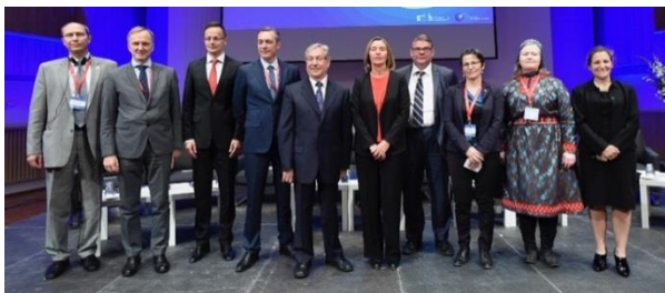
Namminiilivinnermut, Nunanut Allanut Nunalerinermullu Naalackersuisoq, Suka K. Frederiksen, qaffasissumik ataatsimiinnermi Issittumi suleqatigiinneq pillugu Europa Kommission-imit Finlandimillu aaqqissuunneqartumik peqataavoq junip 15-ani 2017.

Europa Kommission-i EU-milu Nunanut Allanut Sinniisoq 2016-imi ataatsimoorussamik nalunaaruteqarput; "EU-p ataatsimoorussamik issittoq pillugu politikki". Qaffasissumik ataatsimiinneq malitseqartitsineruvoq nalunaarummullu EU-mi Issittumi Ataqtigissaarisut Ataatsimeersuartarfianni aallarniutaasussaavoq, Oulu-mi Finland-mi junip 16-ni pisussaasumi.