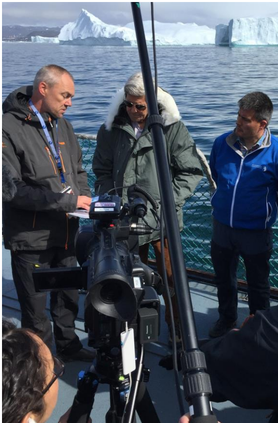
Naalakkersuisut siulittaasuata Kim Kielsenip USA-p nunanut allanut ministererisimasaat John Kerry juunip 17-ani 2016-mi tikeraartoraa

Allat nunat tamalaanut tunngasut suliassaqarfiit Naalakkersuisunut soqutiginaatillit ilarpassuilu nunanut allanut tunngasuni immikkoortortaqaqfimmi aallartitaanillu peqataaffigineqartut Immikkoortoq II-mi uani nassuiaammi tamakkiisumik allaaserineqarput.