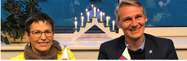
Namminiilivinnermut, Nunanut Allanut Nunaleri nermullu Naalakkersuisoq Suka K. Frederiksen aamma Savalimmiuni aalisar- nermut ministeri Høgni Hoydal.