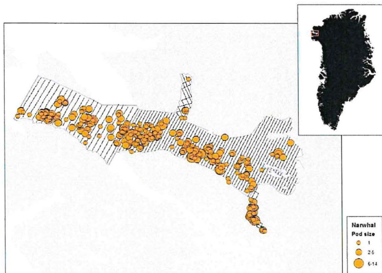
Takusutissiaq 1. Ittoqqortoormiit kangerlussuani qilalukkanik qernertanik 2017-imi (qulaatungaaniittoq) kisitsinermi qernertanik takuffiusimasut (aappaluttut) aammalu Qaanaap kangerlussuani 2019-imi (alleq – sungaartut). Titarnerit qernertut tassa timmisartup ingerlaarfigisimasai (transekter), taakkulu taaneqarsinnaapput imartap kisitsiffiusup tamakkerluni peqassusianik ersitsersitseqataasut.

kisitseqatertik qanoq takusaqartigisimappat ilisimasaqanngivittarlutik. Taamaalillini takuneqartarpoq kisitsisut ataasiakkaarlutik qanoq qernertanik ingerlaarfimminni takusaqarnissamik tappitsiginerat.