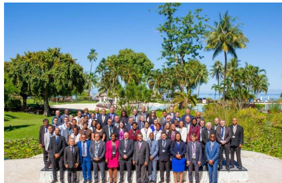
Europa-Kommissioni, OLT-mi ministerit aallartitallu, OLT-EU Forum 2019, Tahiti, Fransk Polynesia.

OLT-it ministeriisa ukiumoortumik ataatsimiinnerini OCTA-mi suleqatigiinnermut naalakkersuinikkut sinaakkutissat aalajangersarneqartarput. Ilinniartitaanermut, Kultureqarnermut Ilageeqarnermut Nunanullu Allanut Naalakkersuisoq Nunap Imarpiup akianiittut Nunasiaataasimasullu (OLT) Fransk Polynesiami ukiumoortumik ministeriisa februar 2019-imi ataatsimiinneranni peqataavoq. Ministerit ataatsimeersuarnerat OCTA aamma OLT-iit akornanni qullersaalluni aalajangiiffiusartutut atornerqartarpoq. Ataatsimeersuarnermi siunertaavoq ataatsimoorluni naalakkersuinikkut pingaarnertutissat ukiup tulluuttup ingerlanerani naammassineqartussatakuersissutigineqartarnissaat. Tassunga atatillugu taamanikkut Naalakkersuisuusup OLT-illu ministeriisa najuuttut tamarmik ukiumoortumik Naalakkersuinikkut Nalunaarut atsiorpaat Allaffissornikkullu Periaaserineqartussat akuersissutigalugit. Pissutsit arlallit akornanni Naalakkersuinikkut Nalunaarummi OLT-imik aaqqissuussinerup aamma Kalaallit Nunaata peqatigiinnermik isumaqatigiissutaata 2021-2027-imiit ataatsimuulersinnissaannut Europa-Kommissionip siunnersuutaanut sammisuupput. Aammattaq OLT-meersunit kajumissaarutigineqarpoq Brexitimut tunngatillugu OLT-eermit soqutigisaat aammalu siunissami EU-p Tuluut Nunaatalu niueqatigiinnikkut sinaakkutaat eqqarsaatigineqassasut.