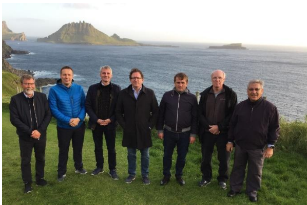
Atlantikup Avannaani Aalisarnermut ministerit. Saamerlermiit Norge (atorfilittat), Kalaallit Nunaat, Savalimmiut, Island, Rusland, Canada (atorfilittat), EU (kommissæri).

Kalaallit Nunaannit, Islandimit, Savalimmiunit, Ruslandimit aalisarnermut ministerit kiisalu EU-mi aalisarneq pillugu kommissæri ataatsimeersuarnermi peqataapput. Norge aamma Canada atorfilittamik qaffasissumik inissisimaffilinnik sinniisuuffigineqarput.