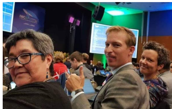
Brasiliami 2018-imi pisassiissutit pillugit Naalagaaffiup IWC-mi aallartitani ilaasortai.

Pisassiissutit pillugit ataatsimiinneq september 2018-imi Brasiliami ingerlanneqarpoq. Tassani suliniaqatigiiffimmi isummat nikinnerat kingumut saqqummeqqipput. Brasiliap Florianopolisnalunaarutaa akuerineqarpoq naak Piujartitsinissamik Aallaaveqarluni Atuinissamik suleqatigiit annertuumik akerliugaluartut, taakkumi pingaarnertut akerlerimmassuk arferit siunissami "toqussutaasinnaangitsunik" piniarneqartalnissaat. Isumaqatigiinniarnermi naapeqatigiittoqarsinnaasimangilaq naak nunanit allanit isumaqatiginniartoqarsinnaanera sulissutigineqartaraluartoq. Aammattaaq Japanip siunnersuutaa, ilaatigut niuernissaq siunertaralugu nungusaataangitsumik arfanniarnernup aallartinnissaa itigartinneqarluni. Naak nunat attassiinnarusuttut arlaleriarluni oqaloqatiginiarneqarlutillu isumaqatiginiarneqartaraluartut malunnarpoq aningaasarsutigalugu arfanniarnissat aallartinneqarnissaat eqqarsaatigalugu nunat arlallit naalakkersuinikkut pissutsit patsisigalugit tapersersuerusunngitsut. Isummami tassani ilaatigut ilisimatuussutsikkut siunnersuutaasut tunngavigineqartut apeqqutaatinneqangillat.