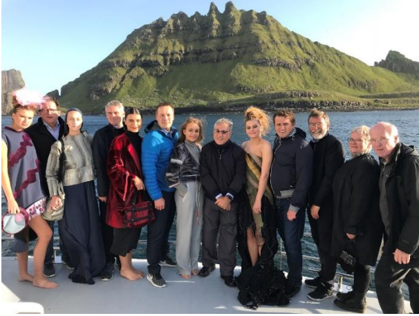
Islandimiit, Savalimmiunit Kalaallillu Nunaanniit aalisakkat amiinik puisillu amiinik atortoqarlutik atisanik ilusilersuisartut suliaannik atisanik takutitsineq 'Blue fashion for the blue growth'.

Issittumi imartaq pillugu nunat tamalaat akornanni aalisarnissamik isumaqatigiissusiornerat oqallisigineqarpoq Atlantikullu avannaani ministerinit sinniisuutitanillu isumaqatigiissummut ilaasunit nersualarneqarluni. Oktobarimi 2018-imi Ilulissani atsiogatigiinnissamut Kalaallit Nunaannit qaaqquisoqarnera pingaartinneqarpoq erseqqissarneqarluni.