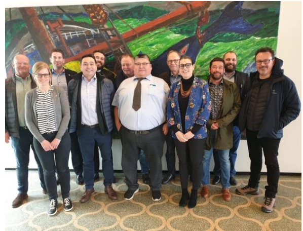
Islandimiut kalaallillu ataatsimoorlutik Aalisarneq pillugu ataatsimiititaliarsuanni ataatsimiinnermi Kalaallit Nunaanniit aallartitat Reykjavikimi ulluni 8-9 marts 2019.

tulaassinissamut periarfissat oqallisigineqarlutik. Taakku saniatigut ataatsimiinnermi aalajangiunneqarpoq qalerallit suluppaakkallu itisoormiut pillugit naalagaaffiit sineriallit isumaqatigiinniarnert aallartinneqassasoq. Isumaqatigiinniarnert siulliit maj 2019-imi K benhavnimi ingerlanneqarput.