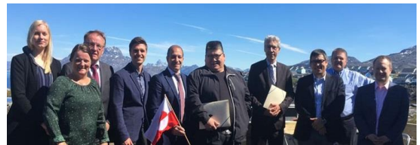
Joint Committeemi Kalaallit Nunaata aamma EU-p akornanni juli 2018-imi Nuummi ataatsimiinnermi peqataasut

2018-imi EU-mik Aalisarnek pillugu peqatigiinnissamut isumaqatigiissummi killiliussat iluanni suleqateqarnermi Joint Committeemi immikkoortunut tapiissuteqartarnek pillugu aaqquissuussineq malillugu juulimi Nuummi ingerlanneqartumi nalunaaruteqartarnermut samminerusimavoq. Ukiakkut Joint Committeemi ataatsimiinneq 2018-imi novembarimi Bruxellesimi ingerlanneqarpoq. Tassani 2019-imut EU-mut tunniunneqartussanik inaarutaasumik aalisagartassiissutiniq aalajangersaanissaq isumaqatigiissutigineqarpoq. Maannakkut tapiliussaq ulloq 31. december 2020-mi naasussaammut aamma 2019-ip ingerlanerani Aalisarnek pillugu peqatigiinnissamut isumaqatigiissummik tassungalu atasunik tapiliussamik nutaamik isumaqatigiinniarnarit aallartinneqassasut aamma isumaqatigiissutigineqarpoq.