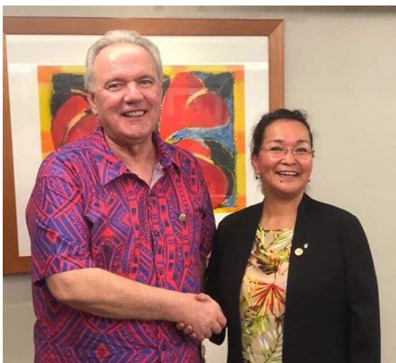
Ilinniartitaanermut, Kultureqarnermut, Ilageeqarnermut Nunanullu Allanut Naalackersuisoq nunanik tamalaanik suleqateqarnermut ineriartornermullu akisussaasoq Europa-Kommissæri Neven Mimica peqatigalugu.

Anguillap pisortatiguunngitsumik ataatsimeeqatiginissaanik periarfissaqarsimalluni. Kingullertut taaneqartup aalisarnermik ingerlataqarfimmini inerisaanissamik kissaateqarpoq aamma takornariaqarneq pingaarnertut isertitaqarfigisarlugu. Illuatungeriit atasuteqarnerup ingerlatiinnarnissaa paasissutissanillu paarlaasseqatigiittarnissaaq isumaqatigiissutigaaq, naak Anguillap qularnanngitsumik Brexiti pissutigalugu OLT-mi suleqatigiinnermit anisussaagaluartoq, tassa Anguilla Tuluit Nunaata ataaniimmat.