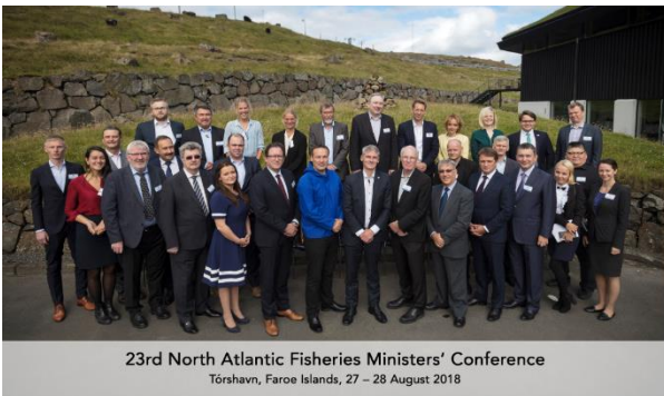
23rd North Atlantic Fisheries Ministers' Conference Tórshavn, Faroe Islands, 27 – 28 August 2018

Issittumi imartaq pillugu nunat tamalaat akornanni aalisarnissamik isumaqatigiissusiornerat oqallisigineqarpoq Atlantikullu avannaani ministerinit sinniisuutitanillu isumaqatigiissummut ilaasunit nersualarneqarluni. Oktobarimi 2018-imi Ilulissani atsiogatigiinnissamut Kalaallit Nunaannit qaaqquisoqarnera pingaartinneqarpoq erseqqissarneqarluni.