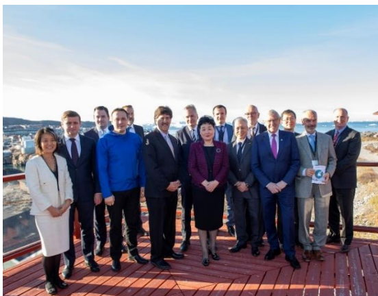
Isumaqatigiissummut peqataasuniit ministerit ambassadørillu. Ilulissat 3 oktober 2018.

Peqataasut 10-t tamarmik atsioreerpassuk isumaqatigiissut atuutsilersinneqassaaq. Taamaalilluni naalagaaffiit sineriallit tallimaallutik tamarmik peqataanngikkunik isumaqatigiittoqarsinnaanngitsoq qulakkeerneqarpoq. Isumaqatigiissutip atulersinnissaanik piareersarluni sulineq isumaqatigiissummut peqataasut akornanni ataatsimiinnerni aallartinneqassaaq, ataatsimiinneq siulleq Canadami Ottawami maj 2019-imi ingerlanneqarluni.