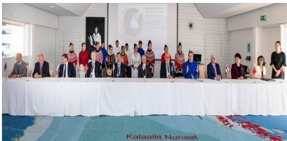
Hotel Arcticimi Ilulissani 3. oktober 2018-imi atsiogatigiinneq.

Taamanikkut Aalisarnermut, Piniarnermut Nunalerinermullu Naalakkersuisuusimasoq Ilulissani ulluni 2 – 4 oktober 2018 peqataasut atsiogatigiinneranni qaaqquisuuvoq.